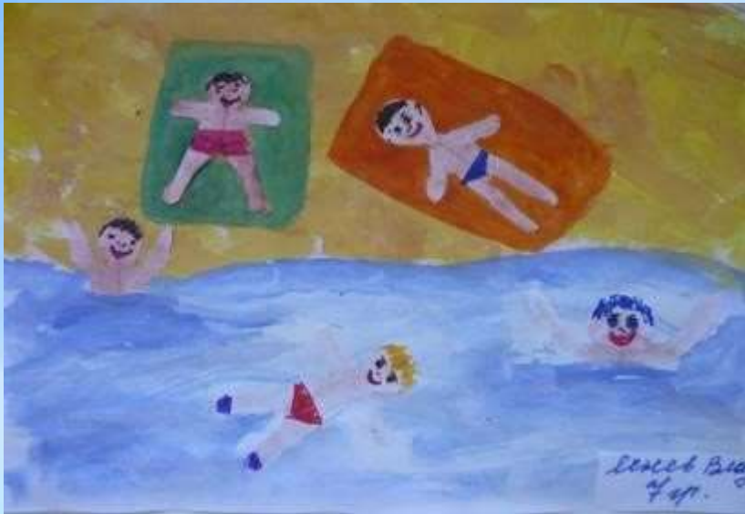
Swimming Pool 7/21