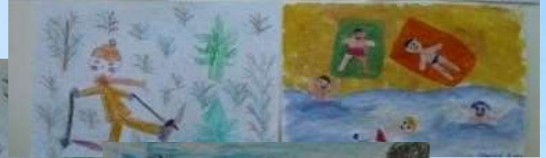
Swimming Pool 7/21