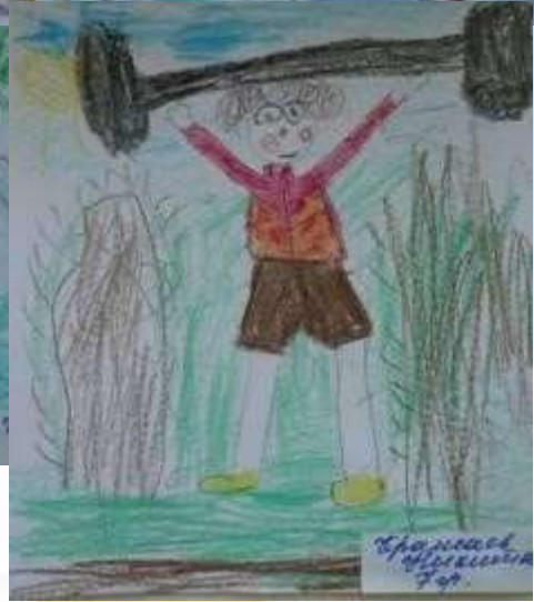
Swimming Pool 7/21