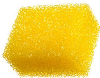
Рисунок – метафора «Губка» (затрагиваемая проблема - воспитание ребенка)

Данный рисунок можно предложить для обсуждения на родительском собрании, посвященном основным принципам воспитания, а в данном случае – принципу воспитания на основе личного примера взрослого.