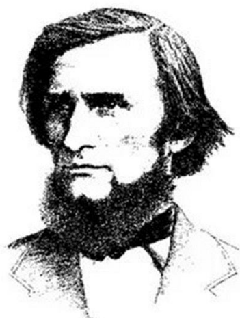
Константин Дмитриевич Ушинский 1824-1871

1 Вед: Константин Ушинский стал основоположником научной педагогики в России. В середине XIX века он переехал из Москвы в Петербург и получил место преподавателя русской словесности в Гатчинском Сиротском институте. В стенах учреждения Ушинский обнаружил большую библиотеку с книгами по педагогике. Прочитанная литература оказала на молодого педагога сильное влияние, и он стал автором «Журнала для воспитания», где публиковал свои статьи о реорганизации