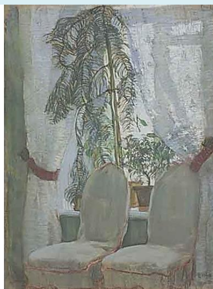
К.Юон. Окно. 1905. Картон, пастель