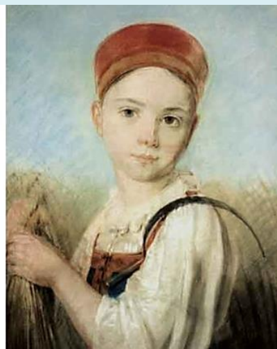
А.Венецианов. Крестьянская девушка с серпом во ржи. Пергамент, дублированный на холст, пастель. Конец 1810 начало 1820-х годов.