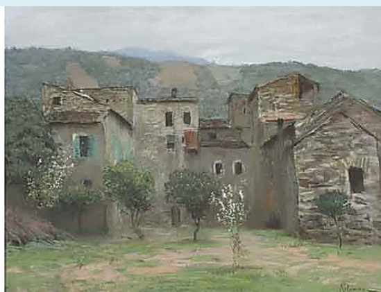
И.Левитан. Вид в окрестностях Бордигеры в Италии. 1890. Бумага, пастель. Вариант одноименной картины (1890. ГТГ)