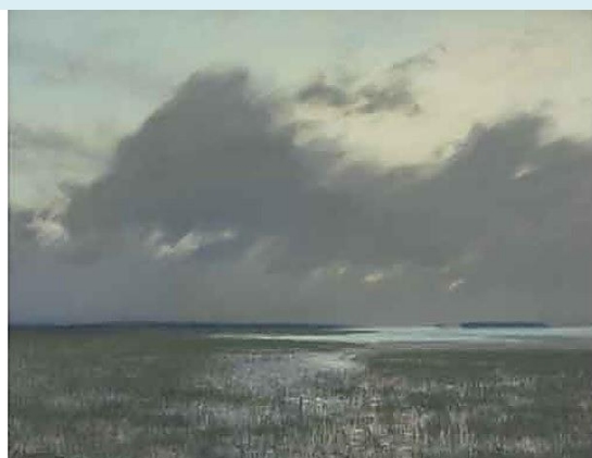
И.Левитан. Разлив. 1895. Бумага на картоне, пастель