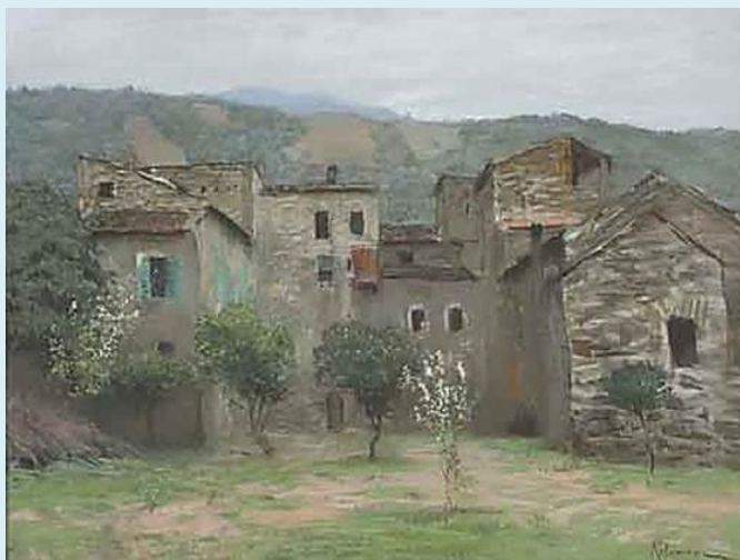
И.Левитан. Вид в окрестностях Бордигеры в Италии. 1890. Бумага, пастель. Вариант одноименной картины (1890. ГТГ)