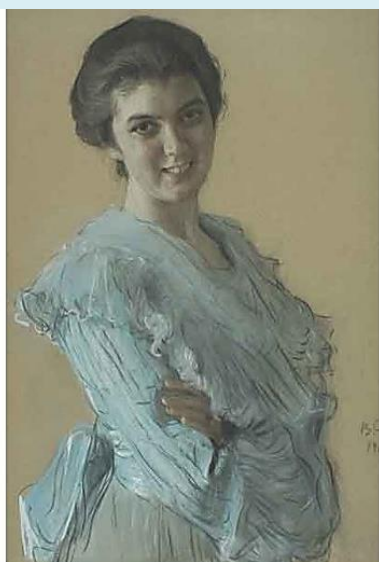
В.Серов. Портрет Нины Хрущевой. 1903. Бумага, пастель