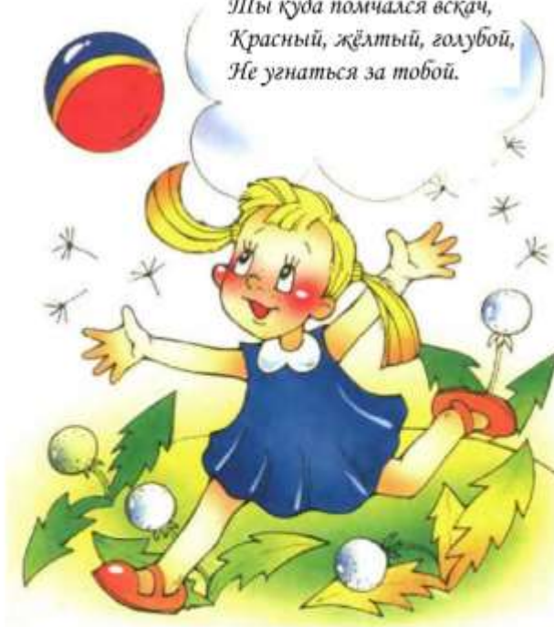
Иллюстрация Людмила С.

Мой весёлый звонкий мяч, Ты куда помчался вскач, Красный, жёлтый, голубой, Не угнаться за тобой.