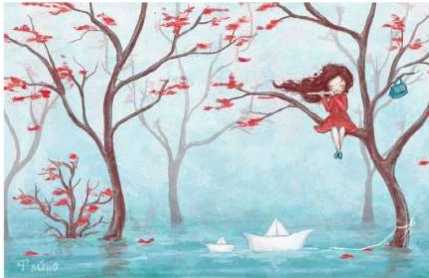
Иллюстрация Татьяны М. М.