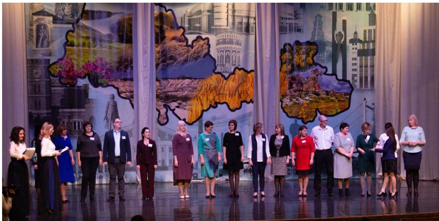
Участники областного конкурса профессионального мастерства «Методист года – 2018»