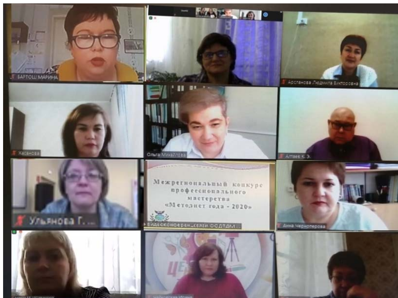
Конкурсное испытание «Онлайн-тестирование»