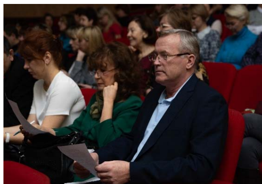
Группа поддержки: гости, коллеги, жюри