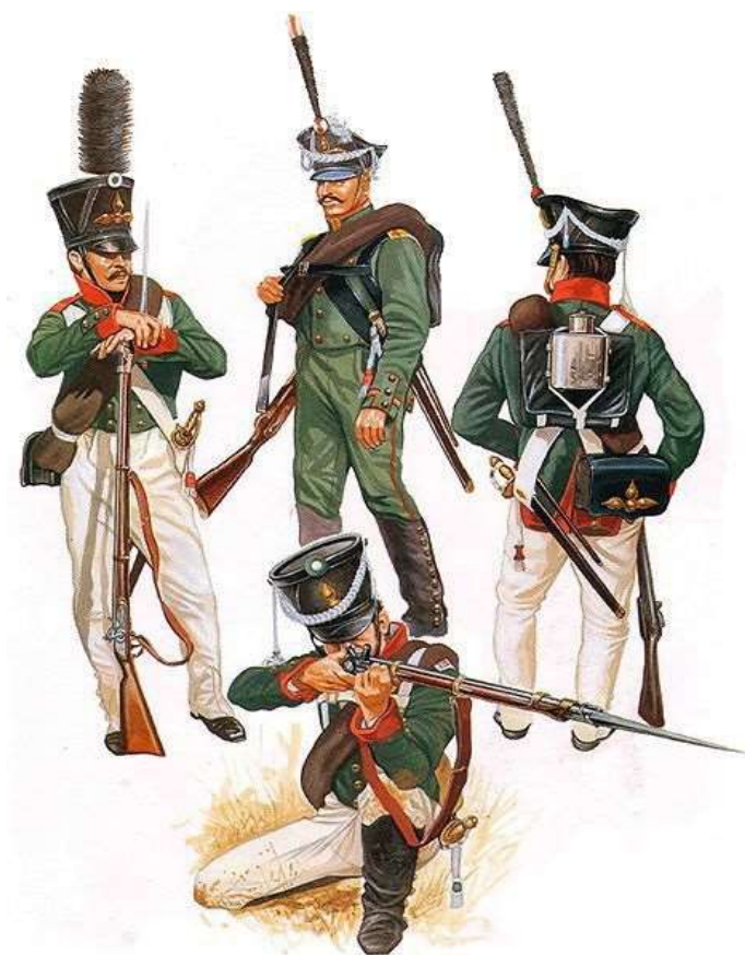
Гренадёры русской армии 1812 года