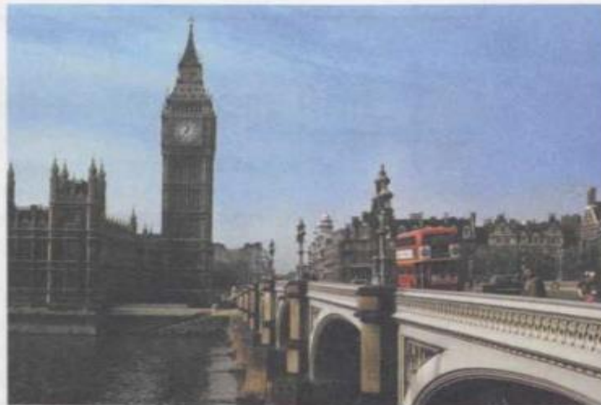
Рис. 5. Лондон

Государство называют Соединённым Королевством или Великобританией по названию самого большого острова. Великобритания — монархия* . Сейчас главой государства является королева Елизавета Вторая. Про королеву говорят: «Царствует, но