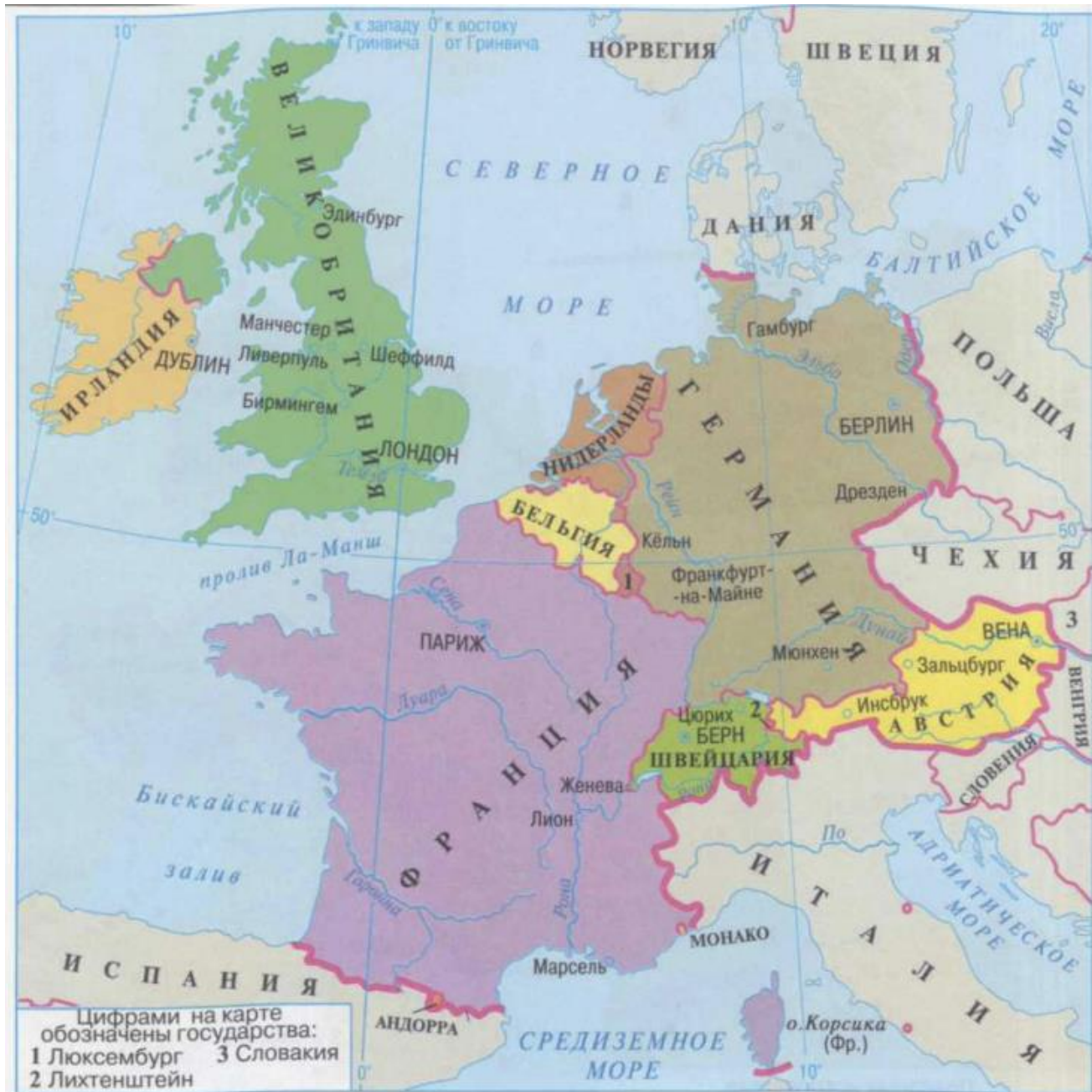
Рис. 3. Политическая карта Западной Европы