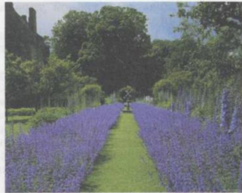
Рис. 4. Английский парк

Раньше в Великобритании было много лесов. Но с разведением овец и занятием земледелием лесá уничтожались и превращались в пастбища и пашни. Сейчас лесов осталось мало. На севере страны произрастают хвойные и смешанные леса. Там встречаются сосны, дубы и берёзы . Склоны гор и горные луга покрыты зарослями вёреска . На юге страны растут дубы, грабы, буки и другие широколиственные породы деревьев. В лесах и на лугах обитают лисицы, зайцы, белки, ежи, кроты, дикие голуби, куропатки, глухари . В стране много парков (рис. 4) и искусственных лесных насаждений.