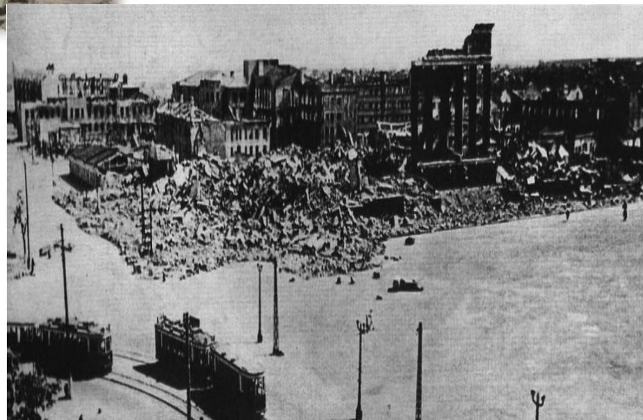
Площадь 20-летия Октября (пл. Ленина)