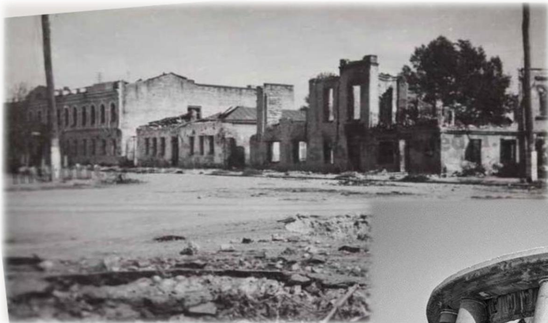
Угол улиц Энгельса и Маркса. 1942 год.