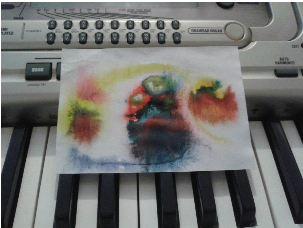
В. Гаврилин «Перзвоны». Музыка вечера.

Не обязательно смотреть и сравнивать результаты друг - друга. Результат может быть совсем неожиданным: минор случится розовым, например, или малиновым, и т.д. Каждый ребенок «видит» музыку индивидуально, так же как слышит или думает. Если проанализировать детские работы (музыка в цвете), можно заметить что они представляют собой цветовую характеристику эмоционального содержания музыкального произведения и собственное настроение, которые представлены доминирующими цветосочетаниями различных цветов и оттенков, специфическими для каждого отдельного музыкального произведения. В следствии работы с цветом можно наблюдать развитие способности улавливать взаимосвязь между цветом, звуком, движением. А так – же передача звука в цвете, выделение звука из общей цветовой гаммы. Создание цветowych композиций бессюжетным рисованием по прослушанному музыкальному материалу – это поиск новых цветowych решений, попытка обогатить палитру звучания, восприятие цвета эмоционально, использование его как средство выражения чувств и переживаний.