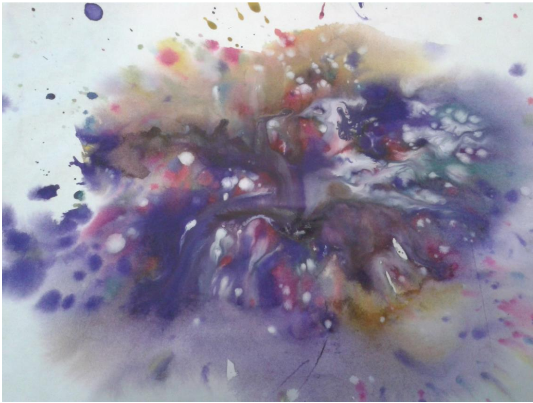
К. Дебюсси «Лунный свет»