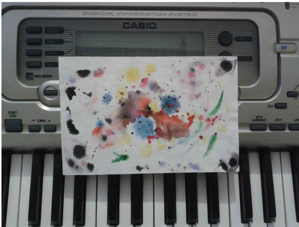
Ф. Шопен Этюд № 12 «Революционный» Выполнила В. Сотникова 6 кл

Звуки природы: шум прибоя, пение птиц, журчание ручья, звуки леса, «наложенные» на музыкальное произведение, или в чистом виде.