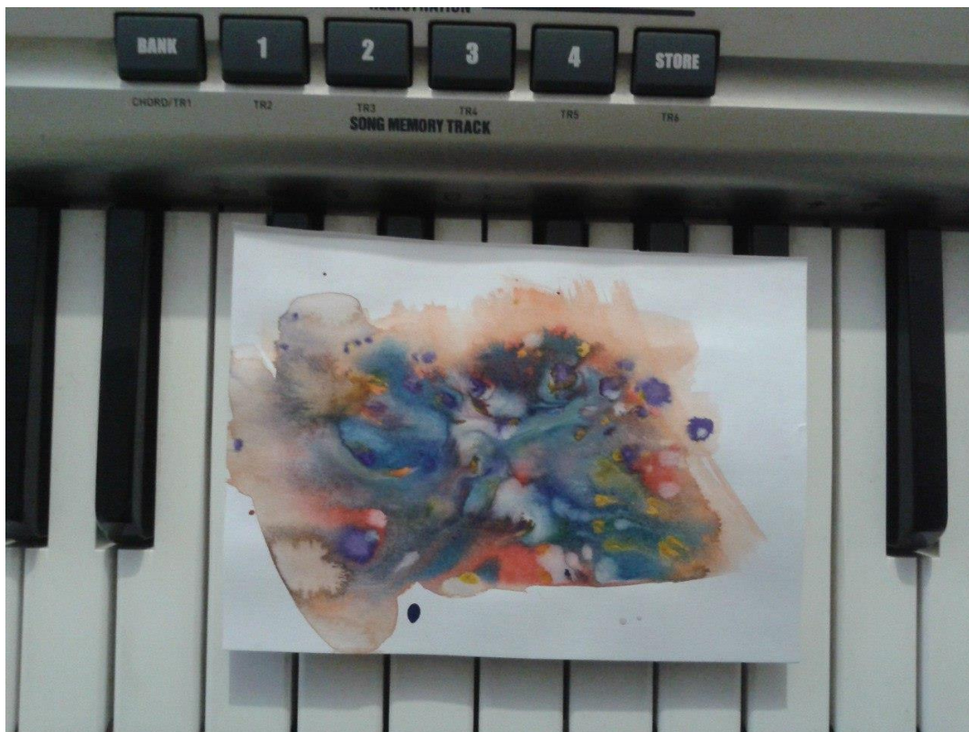
А. Вивальди «Времена года» Весна.