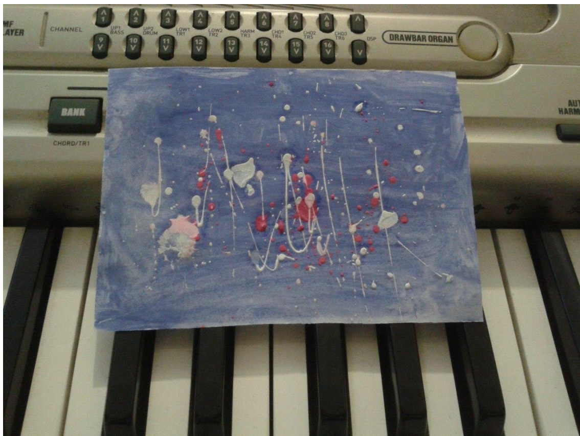
Г. Свиридов «Вальс» из музыки к драме А.С. Пушкина «Метель». Выполнила А.Разина 5 кл.

Творчество во всем: вижу, слышу, чувствую, радуюсь, сопереживаю, думаю, люблю - все становится на одну плоскость называемую жизнью.