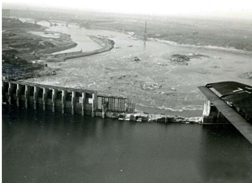
Взорванная плотина ДнепроГЭС в Запорожье, 1941 год

Форсирование реки Днепр в районе Запорожья, 1943 год