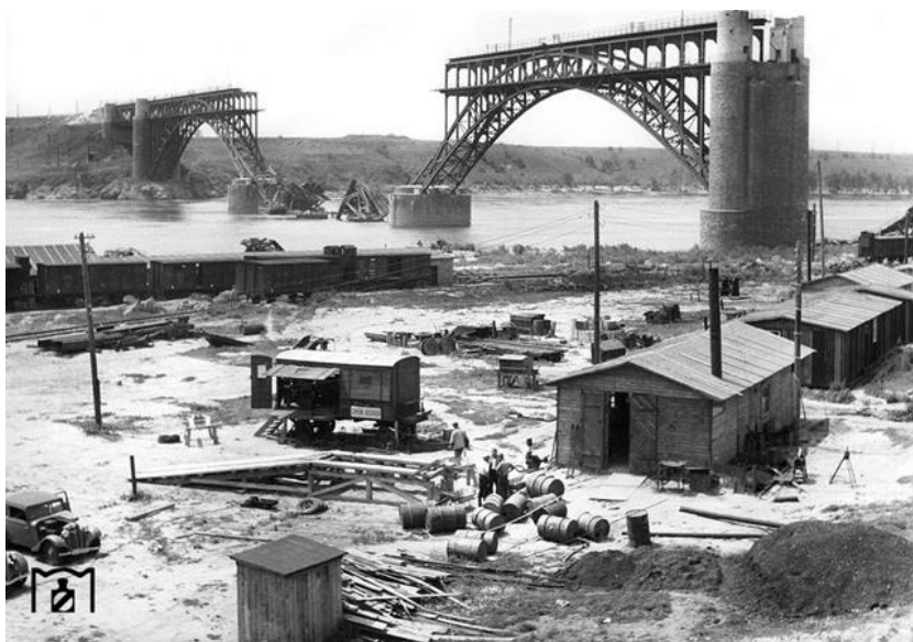
Разрушенные мосты на остров