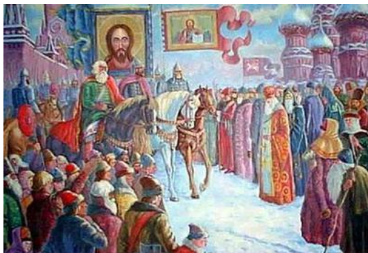
Минин и Пожарский въезжают в Москву. Художник А.М.Смолин