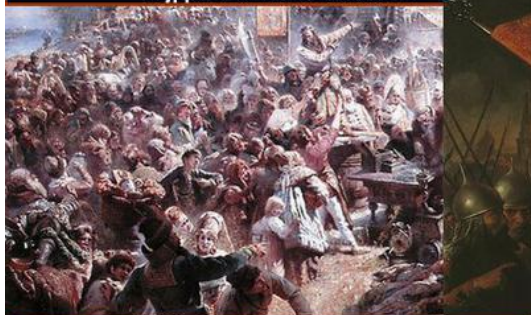
Маковский Константин Егорович (1839-1915) "Воззвание Минина" 1896г