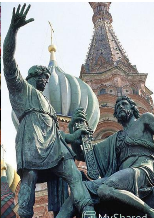
Памятник Минину и Пожарскому. Скульптор И. Мартос.

Праздник ДЕНЬ НАРОДНОГО ЕДИНСТВА - дань глубокого уважения к тем знаменательным страницам отечественной истории, когда патриотизм и гражданственность помогли нашему народу объединиться и защитить страну от захватчиков. Преодолеть времена безвластия и укрепить Российское государство.