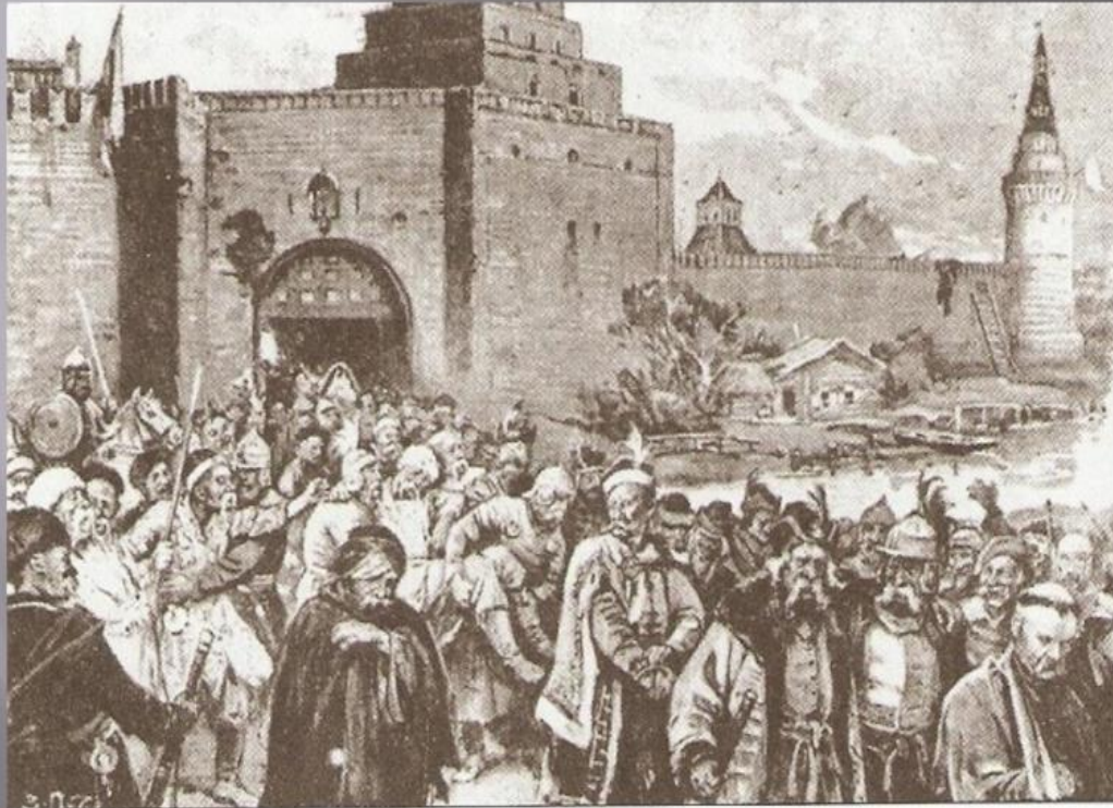
Выход поляков из Кремля