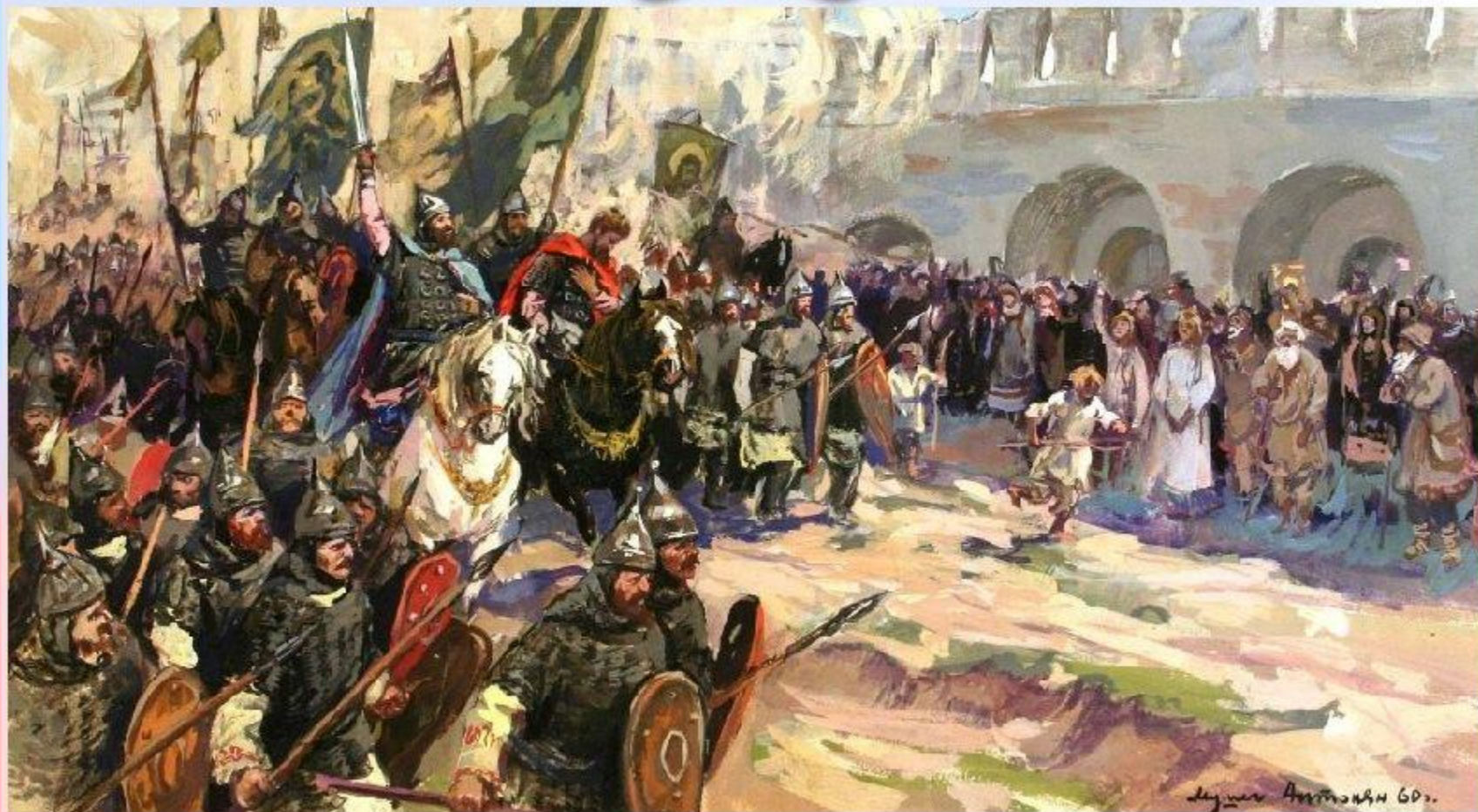
М.Л.Антонян.Выступление Минина и Пожарского из Ярославля в 1612 году