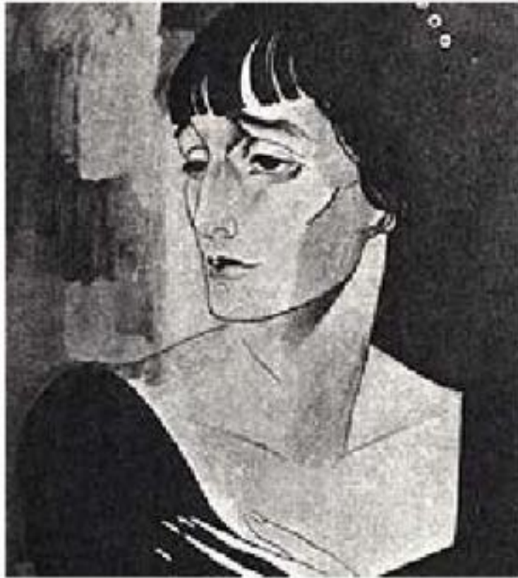
Анна Андреевна Ахматова