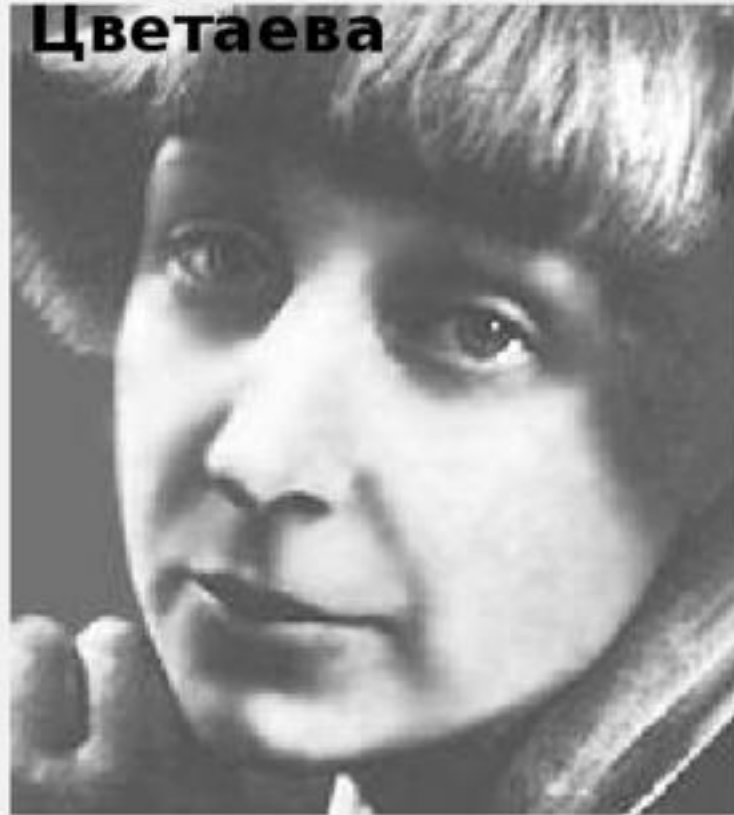
Марина Ивановна Цветаева