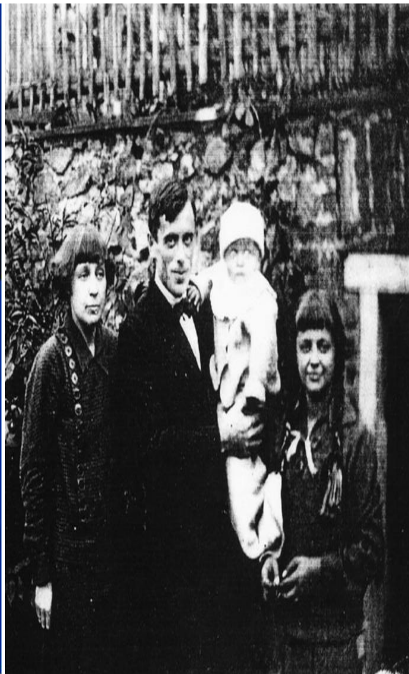
А.Ахматова с сыном Львом Гумилёвым