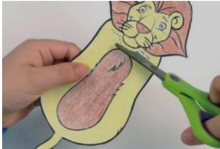
Рисунок 2. Вырезаем фигуру

Шаг 3. Далее необходимо придать фигуре необходимый объем. Отгибаем шею и хвост фигуры: «Fold the face and fold the tail».