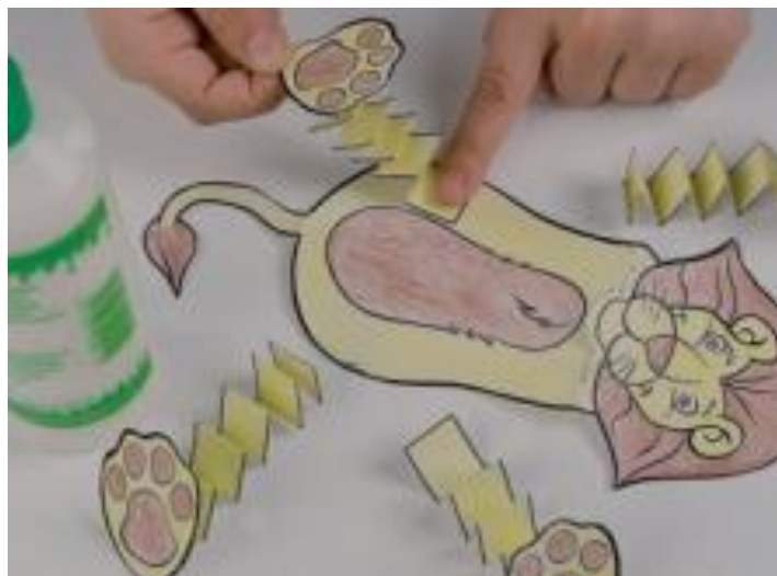
Рисунок 4. Фиксация лап и ног фигуры

Шаг 5. С помощью клея приклеиваем ноги к туловищу: «Now stick the paws on the legs and stick the legs on the body» (рис. 4)