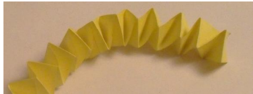
Рисунок 3. Ноги льва из бумаги

Шаг 5. С помощью клея приклеиваем ноги к туловищу: «Now stick the paws on the legs and stick the legs on the body» (рис. 4)