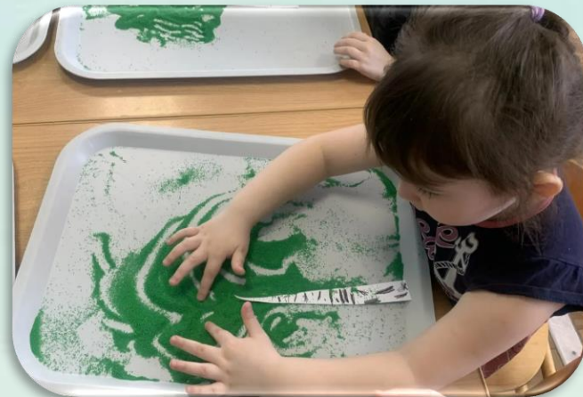
Рисование «Береза» с помощью цветного песка, используя разные техники