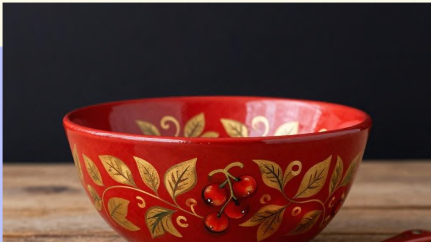
Хохлома — яркие и тёплые краски

Гжель известна синими и белыми цветами, украшенными цветочными мотивами. Роспись тщательная и светлая, подчёркивающая красоту изделий.