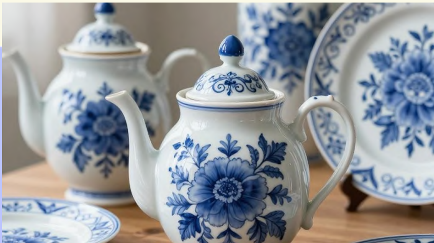
Гжель — живописные синие узоры

Гжель известна синими и белыми цветами, украшенными цветочными мотивами. Роспись тщательная и светлая, подчёркивающая красоту изделий.