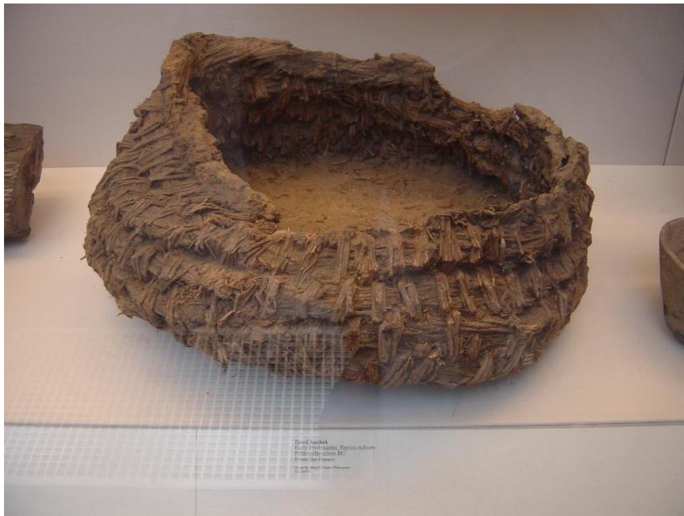
Head basket Early Prehistoric, Pigeon culture Pith and birch bark, BC From the figure © 2011, The C. D. Clark Foundation A. 101

Первобытные люди научились плести корзины из прутьев, а для прочности обмазывали их глиной и высушивали на солнце. В них можно было хранить сухие продукты, но воду наливать было нельзя, потому что глина размокала.