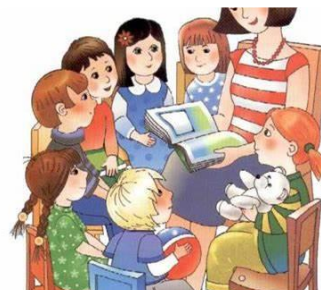
Рассказ о своем микробе