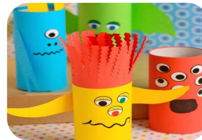
Изготовления микробов в семье