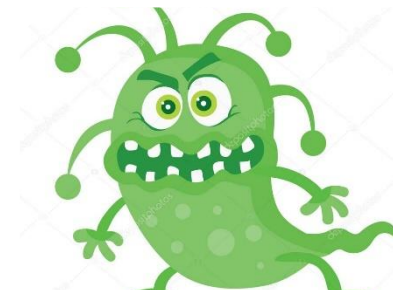
Фотовыставка Микробы враги или друзья