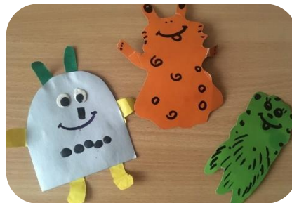
Знакомство с образцом поделки воспитателя