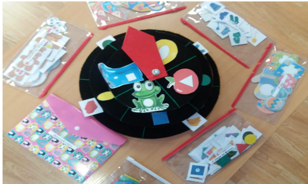
Рисунок 3 – Дидактическое пособие «Круги Луллия».

На круге диаметром 10 сантиметров приклеиваем стрелку из самоклеющейся бумаги. Устанавливаем его сверху. Круги и стрелка свободно вращаются по часовой стрелке и против часовой стрелки – рисунок 3.