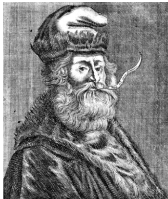
Рисунок 1 – Раймунд Луллий (поэт, философ, мыслитель XIII века)

Свое название изобретение «Круги Луллия» получило в честь имени своего создателя Раймунда Луллия (поэта, философа, мыслителя XIII века) – рисунок 1.