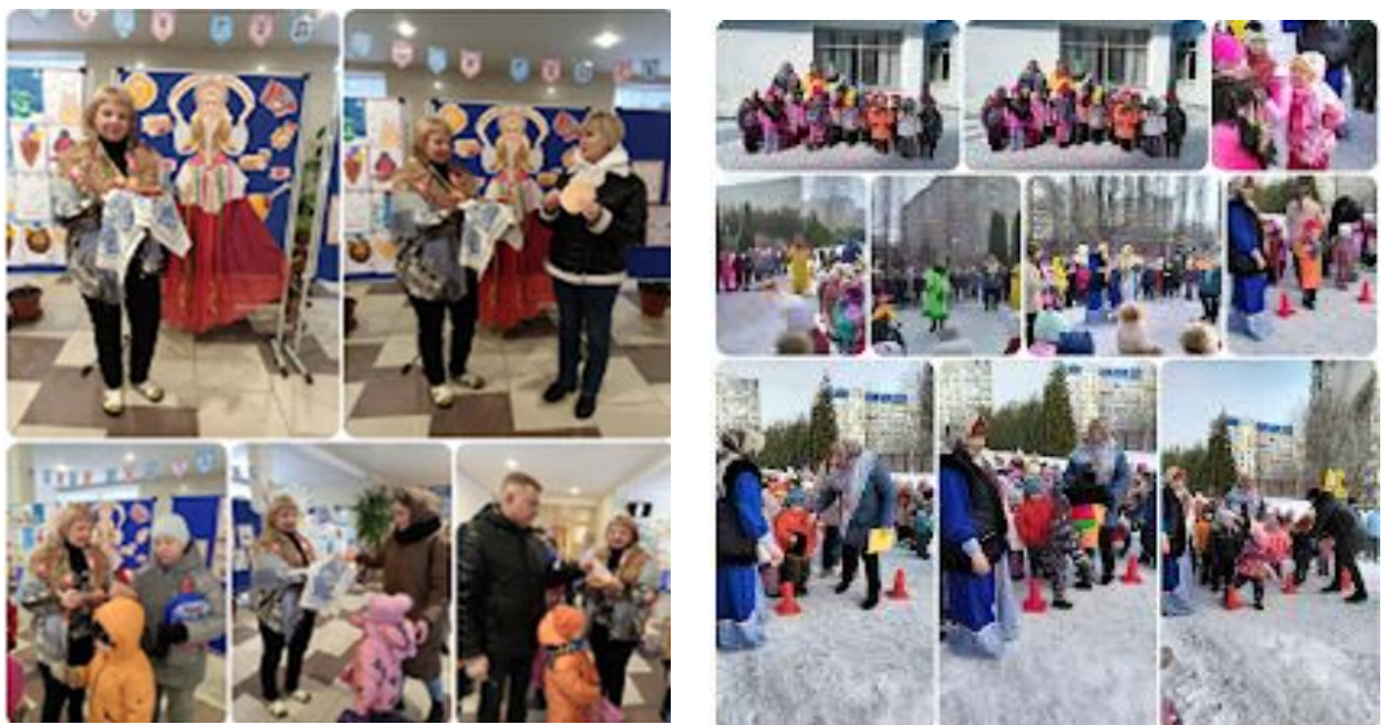
«Народные праздники на Руси».

В рамках нашего проекта было проведено много бесед по темам: «Мой дом, моя семья», «История происхождения города Саратова», «Из далека долго течёт река Волга», «Хлеб - богатство России», «Тот герой, кто за Родину горой»; «Богатыри земли русской», «Русские народные промыслы»,